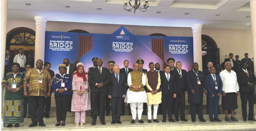
ՀՀ Պաշտպանության նախարար Սուրեն Պապիկյանը Հնդկաստան կատարած աշխատանքային այցի ընթացքում «Աերո Ինդիա» ցուցահանդեսի շրջանակներում մասնակցել է պաշտպանության նախարարների խորհրդակցությանը. մասնակիցների խմբանկարը Հնդկաստան, 2025 թ. փետրվարի 11