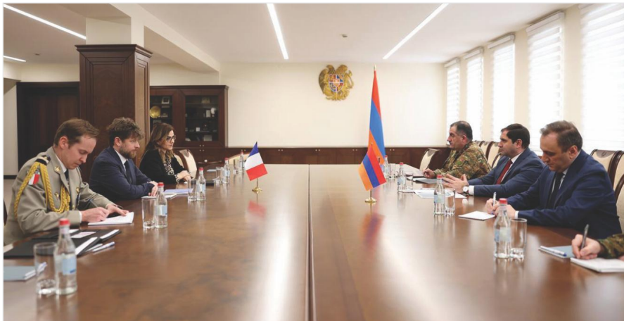
ՀՀ Պաշտպանության նախարար Սուրեն Պապիկյանի և ՀՀ-ում Ֆրանսիայի Հանրապետության Արտակարգ և Լիազոր դեսպան Օլիվիե Դըկոտրինյի հանդիպումը Երևան, 2025 թ. փետրվարի 21