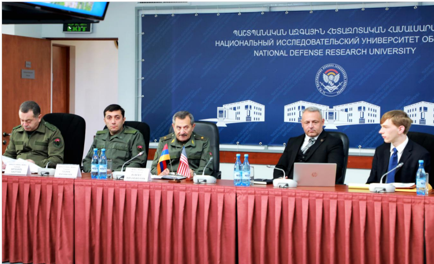
Դրվագ ԱՄՆ-ի Ոչ կանոնավոր պատերազմի կենտրոնի՝ համապարփակ պաշտպանության և ոչ կանոնավոր պատերազմի հարցերով փորձագետ Մեթյու Հեյդելի ՀՀ ՊՆ ՊԱՀՀ կատարած այցից Երևան, ՀՀ ՊՆ ՊԱՀՀ, 2025 թ. փետրվարի 13