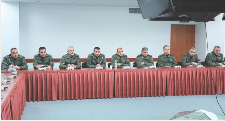
Դրվագ ՀՀ ՊՆ ՊԱՀՀ-ի «ՀՀ ՊՆ և ԶՈՒ-ի ԳՇ ղեկավար կազմի վերապատրաստում» դասընթացի 2025 թվականի առաջին հոսքի մեկնարկի հանդիսավոր արարողությունից Երևան, ՀՀ ՊՆ ՊԱՀՀ, 2025 թ. մարտի 3