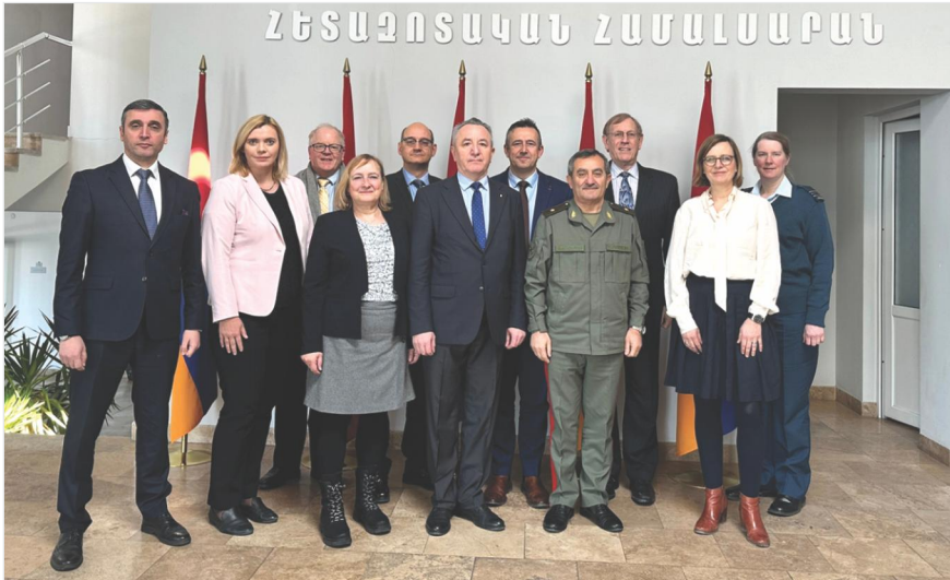
ՆԱՏՕ-ի «Պաշտպանական կրթության զարգացման ծրագրի» խմբի այցը ՀՀ ՊՆ ՊԱՀՀ. քննարկվել են ռազմական կրթության ոլորտում համագործակցության հեռանկարային ծրագրերը Երևան, ՀՀ ՊՆ ՊԱՀՀ, 2025 թ. փետրվարի 26