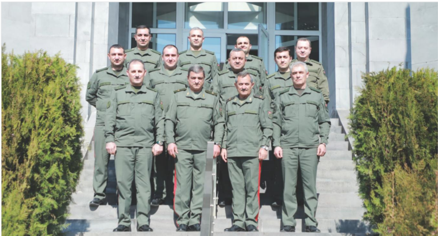
«ՀՀ ՊՆ և ԶՈՒ-ի ԳՇ ղեկավար կազմի վերապատրաստում» դասընթացի 2025 թվականի առաջին հոսքի ունկնդիրների խմբային ավարտական լուսանկարը ՀՀ ՊՆ ՊԱՀՀ-ի պետ գեներալ-մայոր Ա. Բաղդադյանի հետ Երևան, ՀՀ ՊՆ ՊԱՀՀ, 2025 թ. մարտի 14