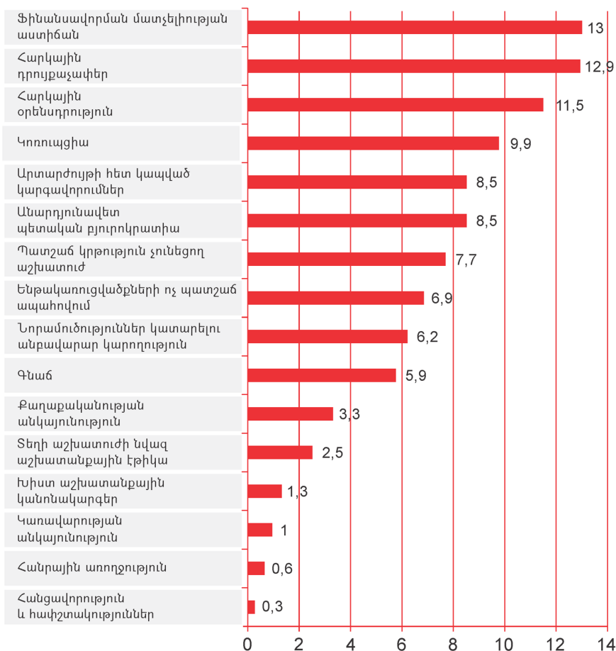
Գծապատկեր 2. ՀՀ-ում ներդրումներ կատարելու համար հիմնական խոչընդոտները (%)